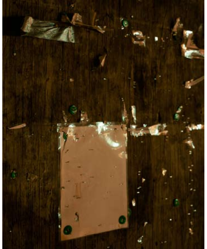
Rut Bles Luxemburg, Bulletin, 2010 82 x 62 cm, C-Print, Framed