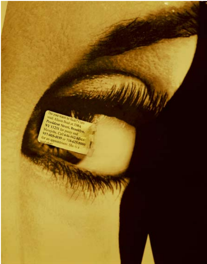
Rut Bles Luxemburg, O, 2010 100 x 78 cm, C-Print, Framed