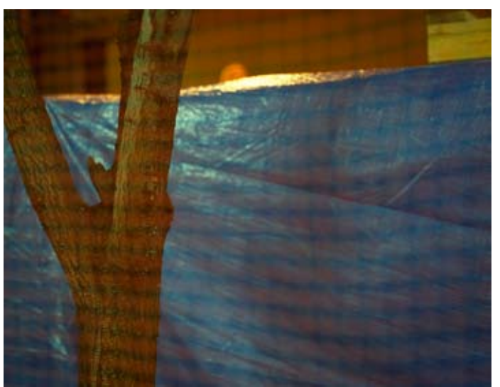
Rut Bles Luxemburg, Set, 2010 77 x 97 cm, C-Print, Framed