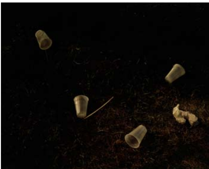
Rut Bles Luxemburg, Corona, 2010 75 x 95 cm, C-Print, Framed